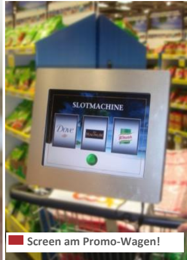
Screen am Promo-Wagen!