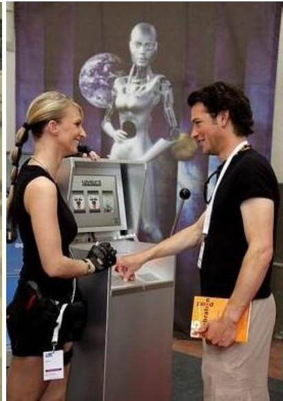
PromotionGame adaptierbar mit Produktbildern und Logo, für die sympathische Kontakt- und Verkaufsförderung