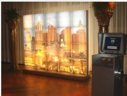
Las Vegas Lichtmodulwand