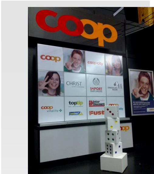
Coop – Bildungsmessen 2010