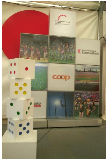
Coop / BLKB – Sponsoring