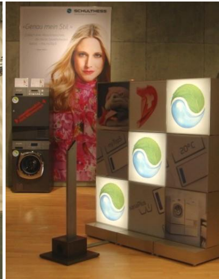
Schulthess – 2010 MUBA, BEA usw.