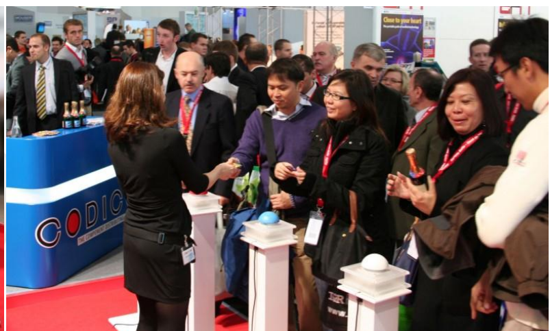
MultiplayerGame „Buzzer-GameShow“ Messespiel / MesseShow für Codico an der Electronica-2010 München