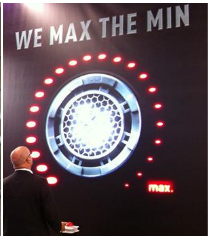
B2B: Neoperl AG an der Messe ISH'13 in Frankfurt

Optisch markantes MEGA-GAME, elektronisches Riesen-Glücksrad kann kundenspezifisch angepasst werden und ist als Miet-Glücksrad, Mietspiel / Messeattraktion ab sofort exklusiv im Sortiment bei: www.infotainment.ch