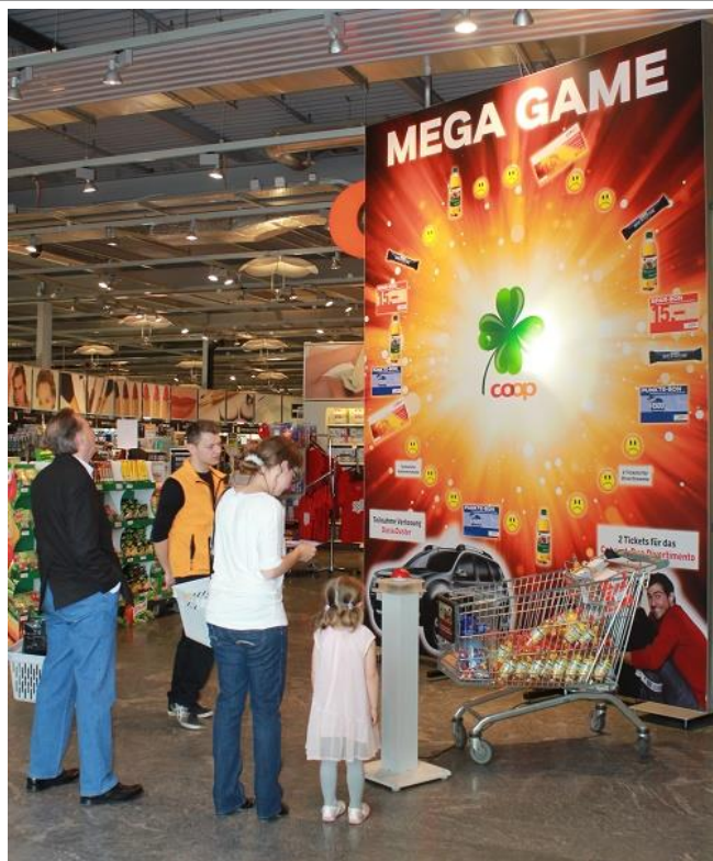
B2C: Coop Megastore Bachenbülach

Coop Megastore, 10 Jahre Jubiläum in Bachenbülach und Dietikon. NEOPERL AG an der ISH'2013 in Frankfurt ... MEGA-Glücksrad.